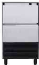
DELTA NG 35