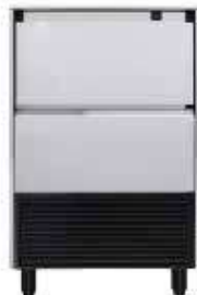
DELTA NG 60