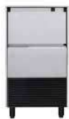
DELTA NG 30