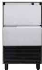
DELTA NG 45